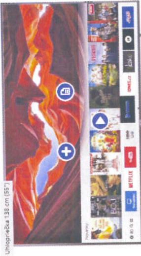
Uhlopriečka 138 cm (55")